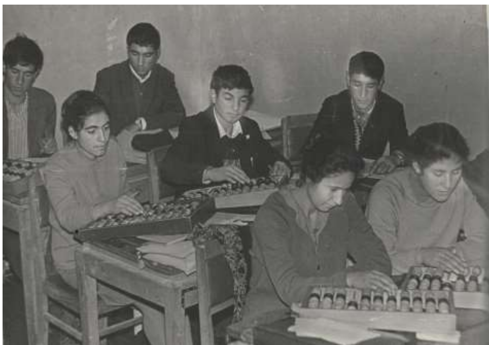
1968-ci ildə Mühasibat uçotu ixtisasının tələbələrinə hesablama qaydalarının öyrədilməsi zamanı