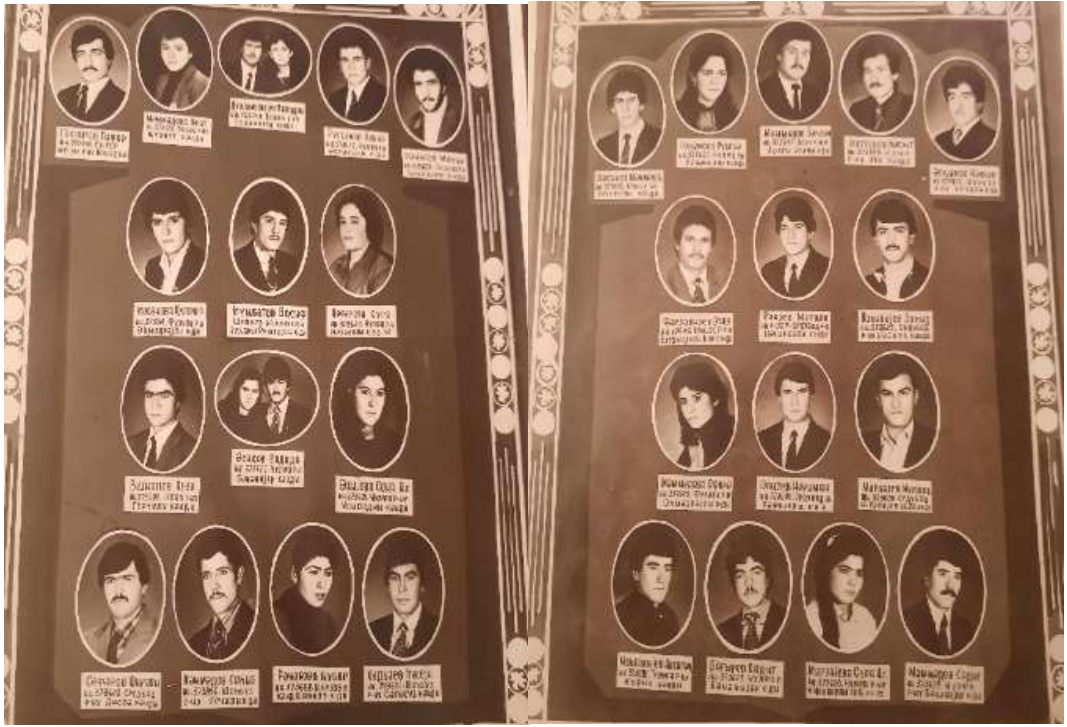
Sonrakı illərin məzunu olmuş gənc tələbələr