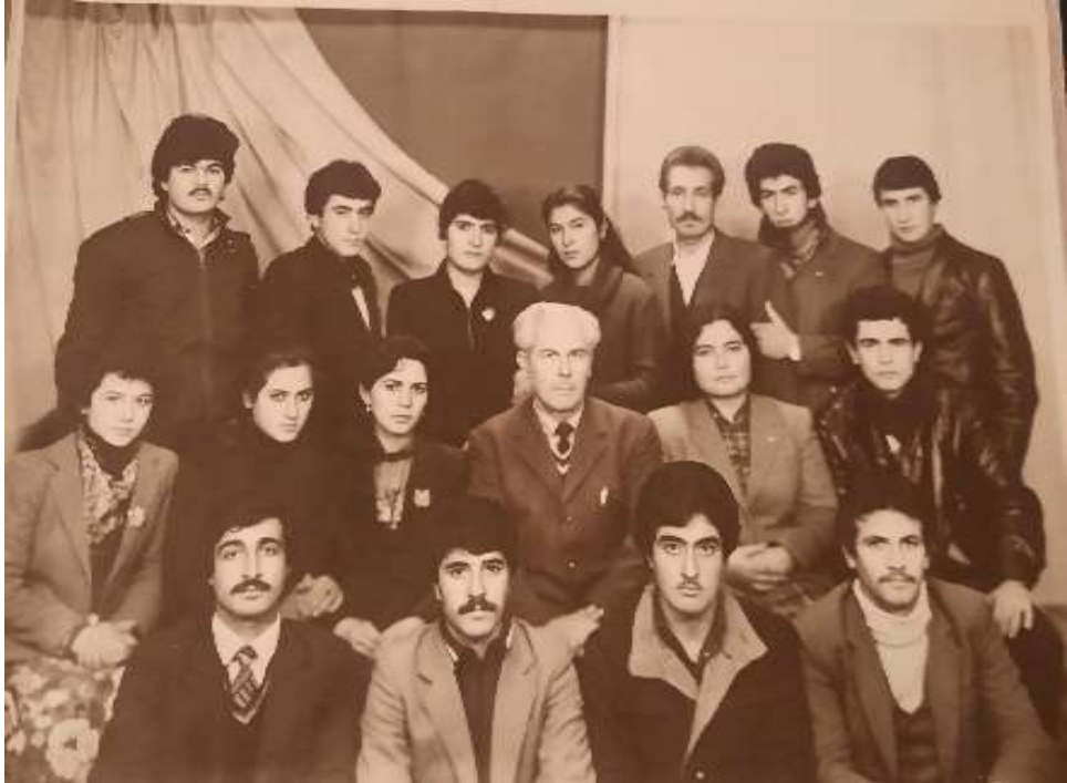
Kollecin müəllim və tələbələri