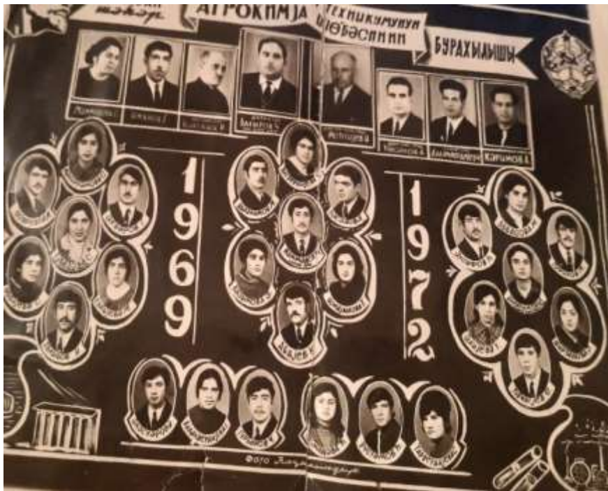
1969-1972-ci illərdə aqrokimya ixtisası üzrə təhsil almış tələbə qrupu