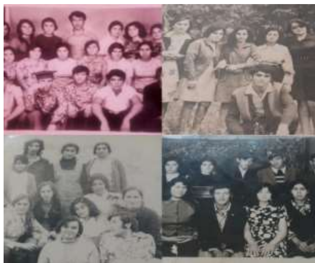
Kollecın direktoru və pedaqoji müəllim heyəti. Mühasibat uçotu ixtisası üzrə təhsil almış istedadlı tələbələr