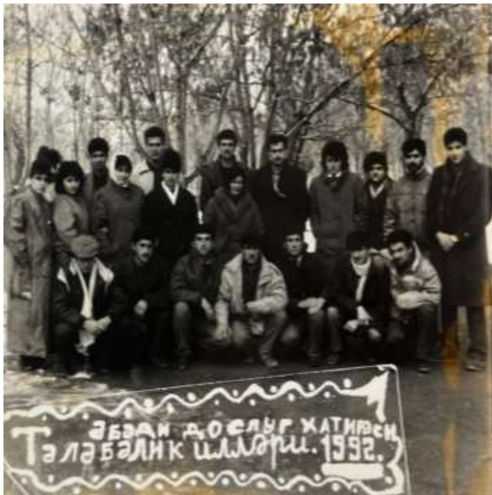
1988-1992-ci illərdə kollecdə aqronom ixtisası üzrə təhsil alan tələbələr