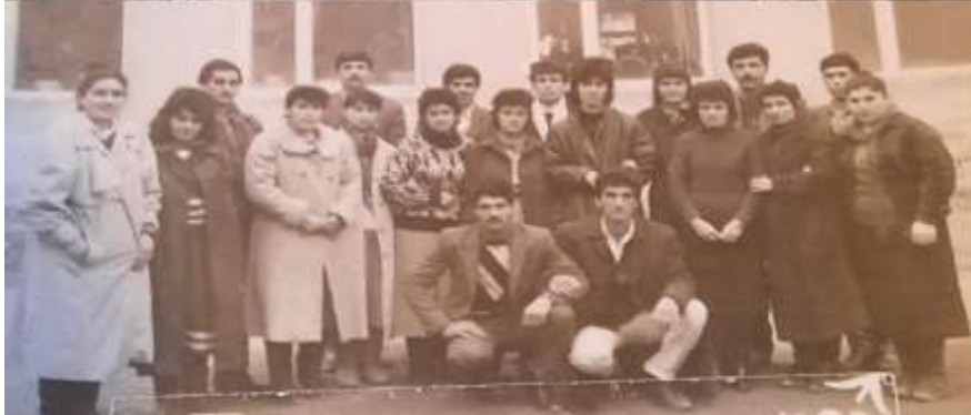
1993-cü ildə baytarlıq ixtisasını bitirmiş gənc və istedadlı məzunlar