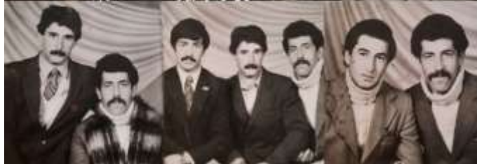
1982-1985-ci illərdə baytarlıq ixtisasında təhsil almış 507-ci qrupun tələbəlik illərindən xatirə